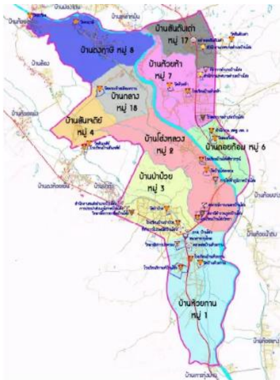
แผนที่เทศบาลตำบลบ้านไโฮ่ง